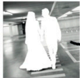
gat ontstaan door lagen te creëren