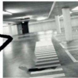
gat opgevuld, 3D ready!

Het is bij 3D belangrijk te weten dat er verschillende mogelijkheden zijn. Er is namelijk al een 3D mogelijk bij 2 lagen, bijvoorbeeld een portret foto i.c.m. een achtergrond, als deze twee van elkaar worden gescheiden en het gat welke in de achtergrond ontstaat wordt opgevuld dan is hier al sprake van diepte.