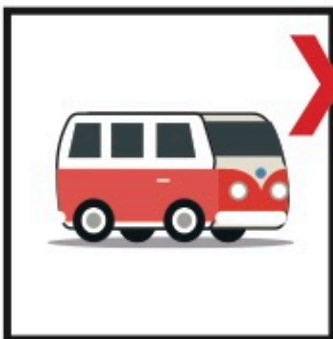
zonder achtergrond (1 laag)