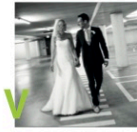
met achtergrond veel diepte te behalen