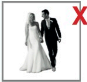
zonder achtergrond geen diepte te behalen